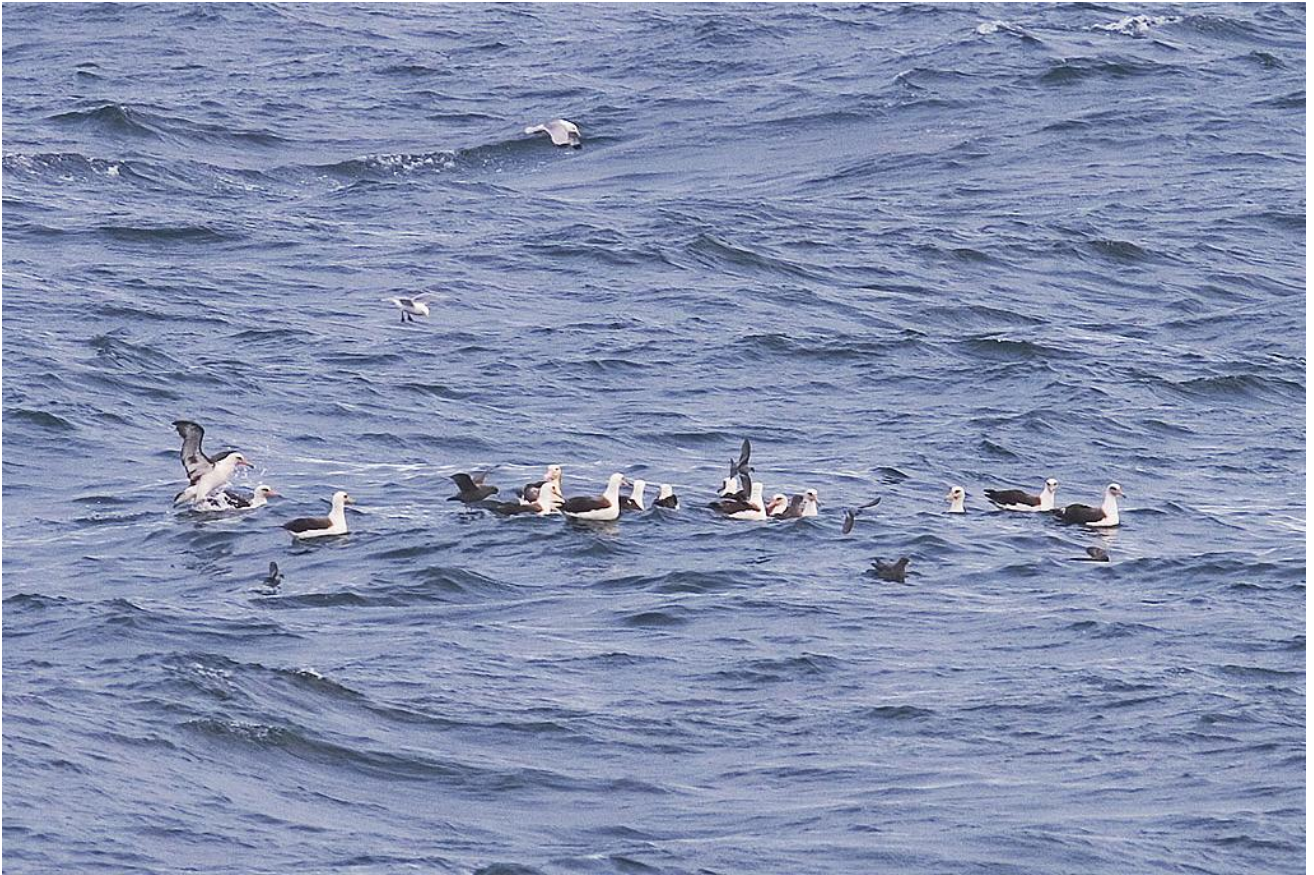
Short-tailed Albatross with Laysan Albatross, Northern Fulmar and Fork-tailed Stormpetrel by Nigel McCall

Max Berlijn Wilhelminastraat 9 6285 AS Epen (LB) Nederland max.berlijn@nn.nl